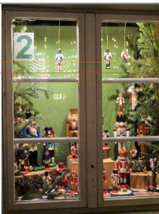
Bilder Ruedi Gass